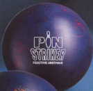
●ネイビー・レッド