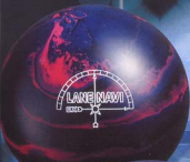
●ネイビー・ブルー