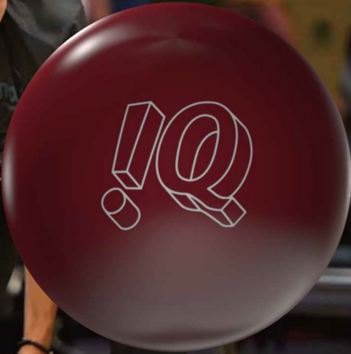
Chris Via Courtesy of STORM