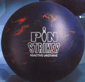
●ネイビー・オレンジ