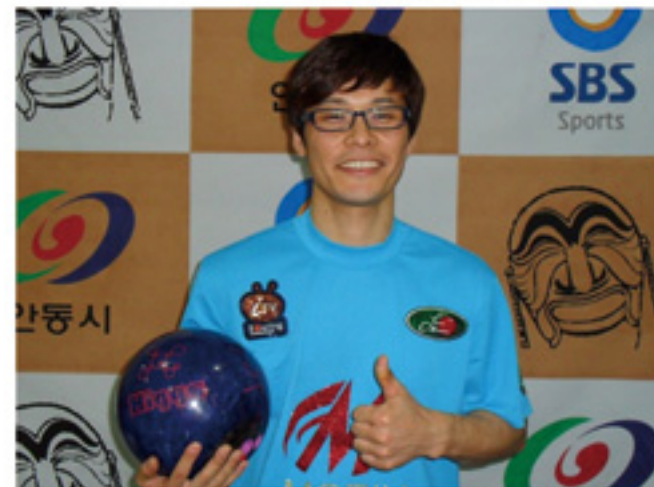
최종인프로 2010 하회탈컵 SBS프로볼링 안동대회 800시리즈(HIGGS볼 사용)