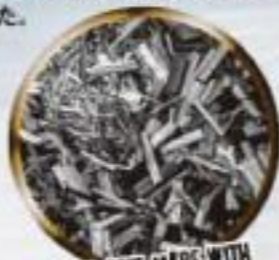
OUTER CORE MADE WITH CARBON FIBER

LEGEND (伝説) と言う名がふさわしい、新たな伝説を生み出すボールに間違いはありません。